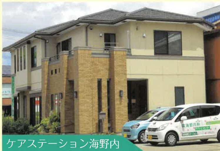
ケアステーション海野内